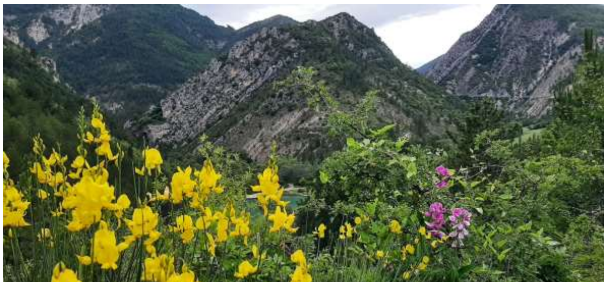
Les couleurs du printemps à Cornillon.